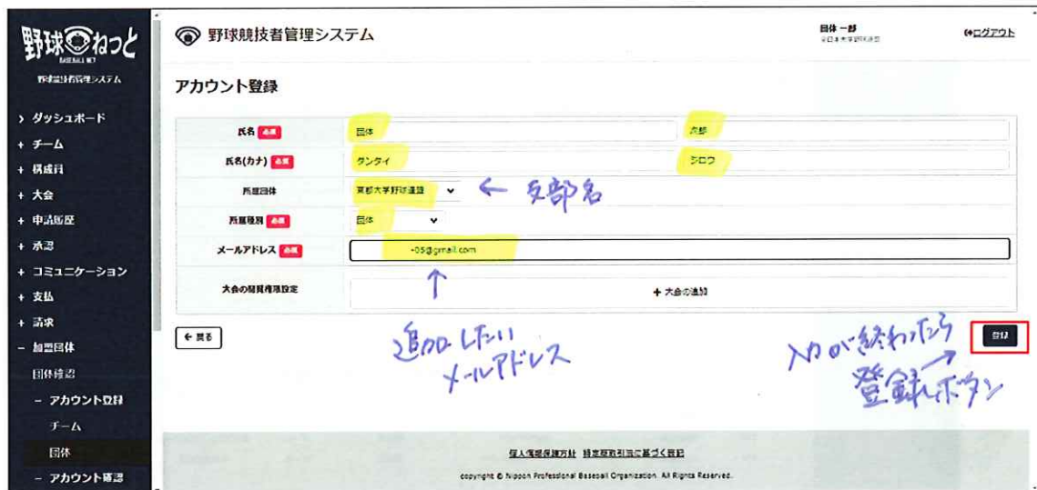
アカウント登録画面