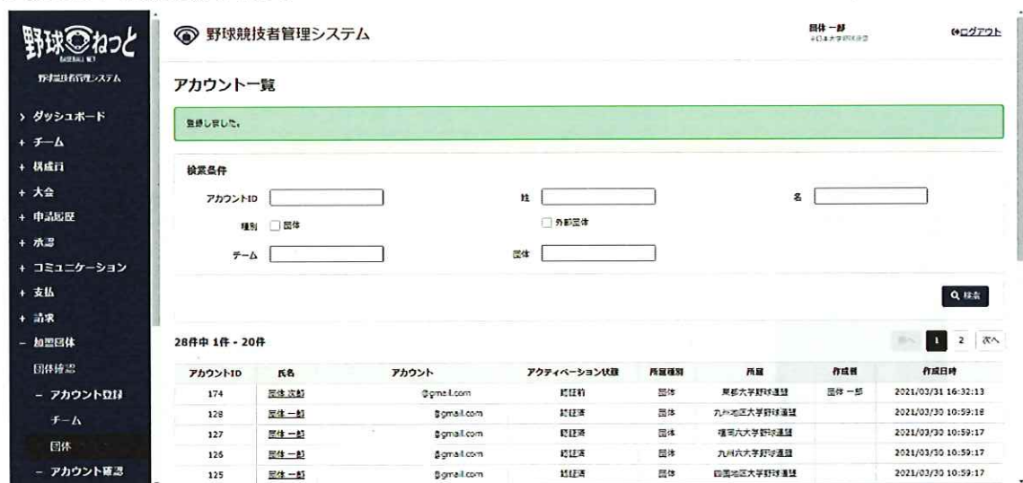
アカウント一覧画面