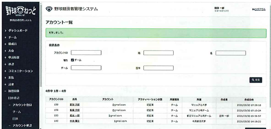
アカウント一覧画面