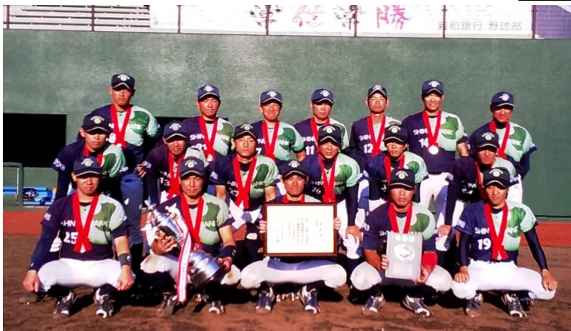
株式会社 親和銀行