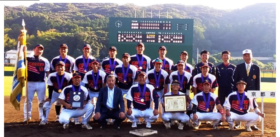
佐川印刷株式会社